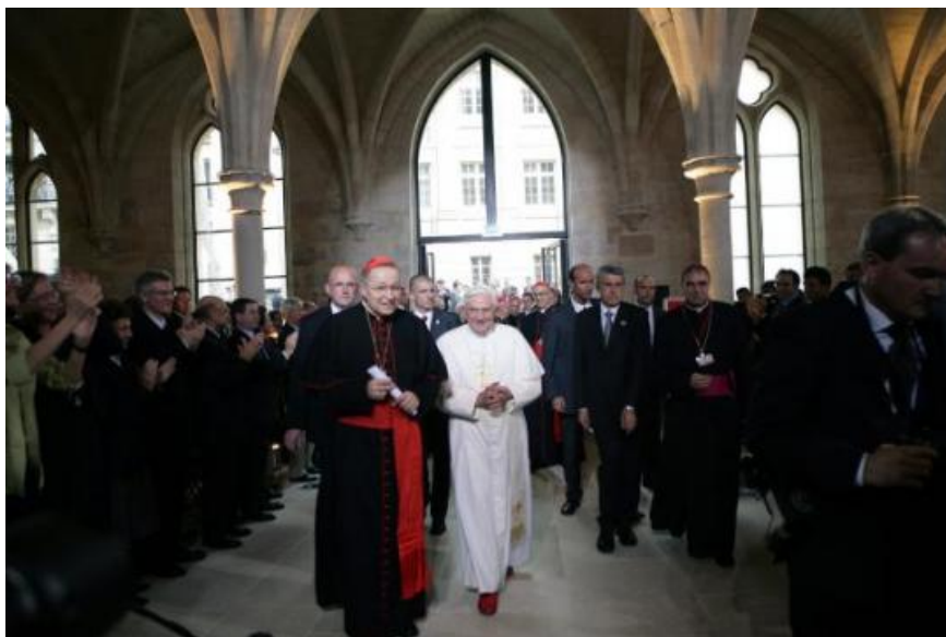
L'antipape Ratzinger-Benoît XVI, le « précurseur de l'Antéchrist » (abbé Soliman)

Entre le faux culte d'un oratoire maçonnisé et une fausse exposition artistique, l'église [secte] Conciliaire de Lustiger-Ratzinger porte bien sa marque de « bête de la terre » du chapitre XIII de l'Apocalypse de Saint Jean, symbole précurseur du règne de l'Antéchrist annoncé par les Saintes Écritures.