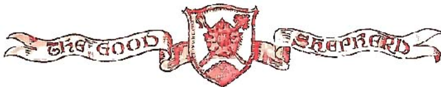
A Traditional, Anglo-Catholic Parish

Dans la pratique, l'IBP (Institut du Bon Pasteur) joue pour le rite Tridentin, un rôle similaire à celui que joue la Provision apostolique pour le rite anglican, pour l'« ordination » des prêtres, pour l'érection de paroisses personnelles avec l'accord de l'évêque.