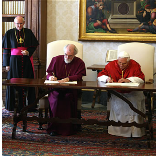
Williams et Ratzinger : Rome, le 23 novembre 2006

Les deux personnages ont même signé une déclaration commune.