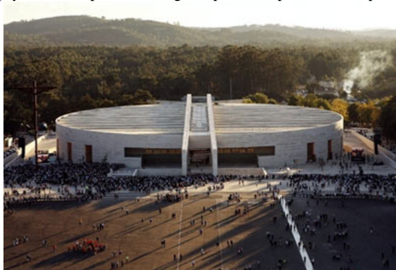
Vue aérienne de la nouvelle église de Fatima

Les 12 / 13 octobre 2007 fut inaugurée la nouvelle « basilique » de Fatima en présence des plus hautes autorités civiles et religieuses du pays. L'abbé apostat Ratzinger dépêcha sur place son complice l'abbé Bertone.