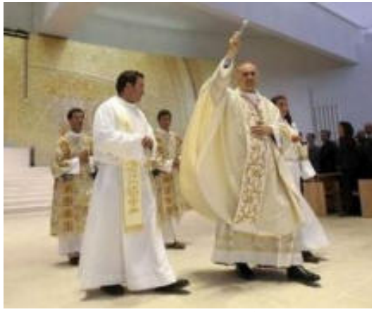
Le « cardinal » Bertone à Fatima

Vous pouvez télécharger ci-dessous l'étude d'un fidèle de la FSSPX à ce sujet :