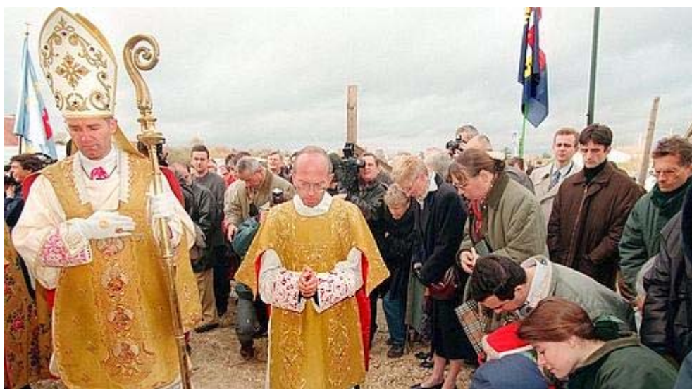
Plusieurs fidèles s'agenouillant au passage de Mgr Bernard Fellay.