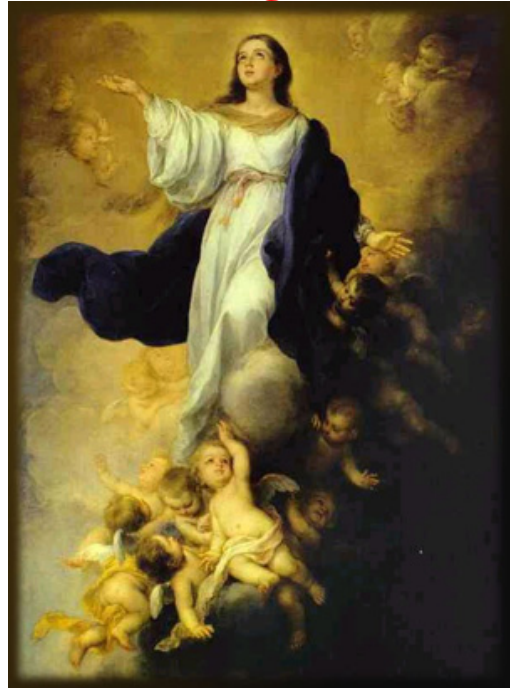
Charles de la Fosse (Caen, musée des Beaux-Arts) (à gauche)

« Inimicitias ponam enter te et mulierem, et sementem tuum et semen illius »