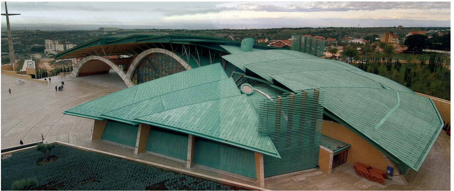
Une vue de face de la "Nouvelle église" dédiée à Padre Pio 3 , à San Giovanni Rotondo (Foggia) – Italie

«Un modèle pour toutes les églises qui seront projetées d'ici cinquante ans» selon Mgr. Crispino Valenziano, membre de la Commission Pontificale pour les Biens Culturels