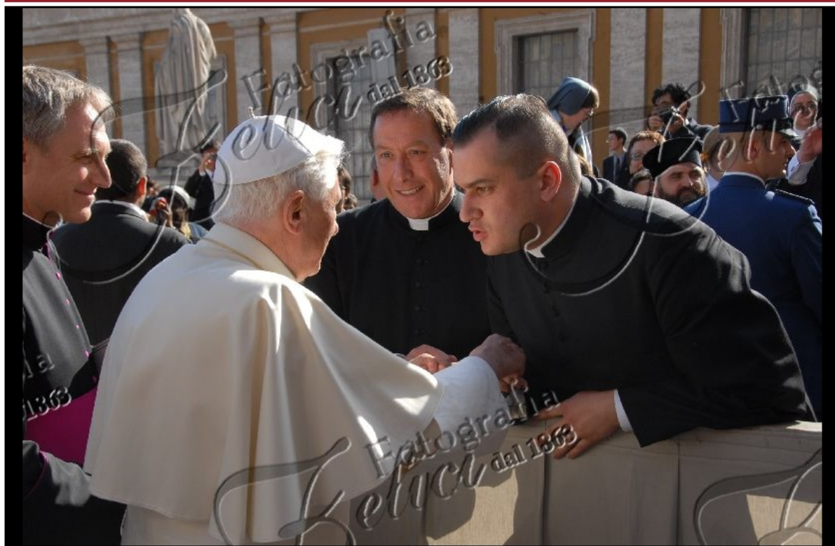
L'abbé Nély était accompagné de l'abbé Ledermann que l'on voit ici avec l'abbé apostat Ratzinger

Quel sourire radieux de l'abbé Nély devant son Maître l'abbé apostat Ratzinger !