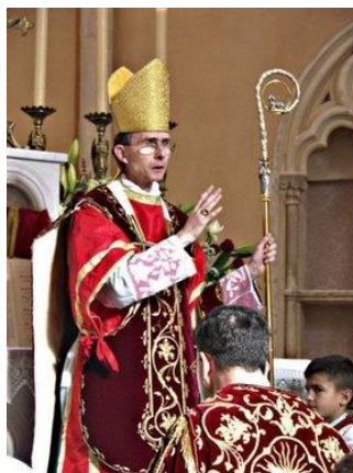
Mons. Bernard Tissier de Mallerai