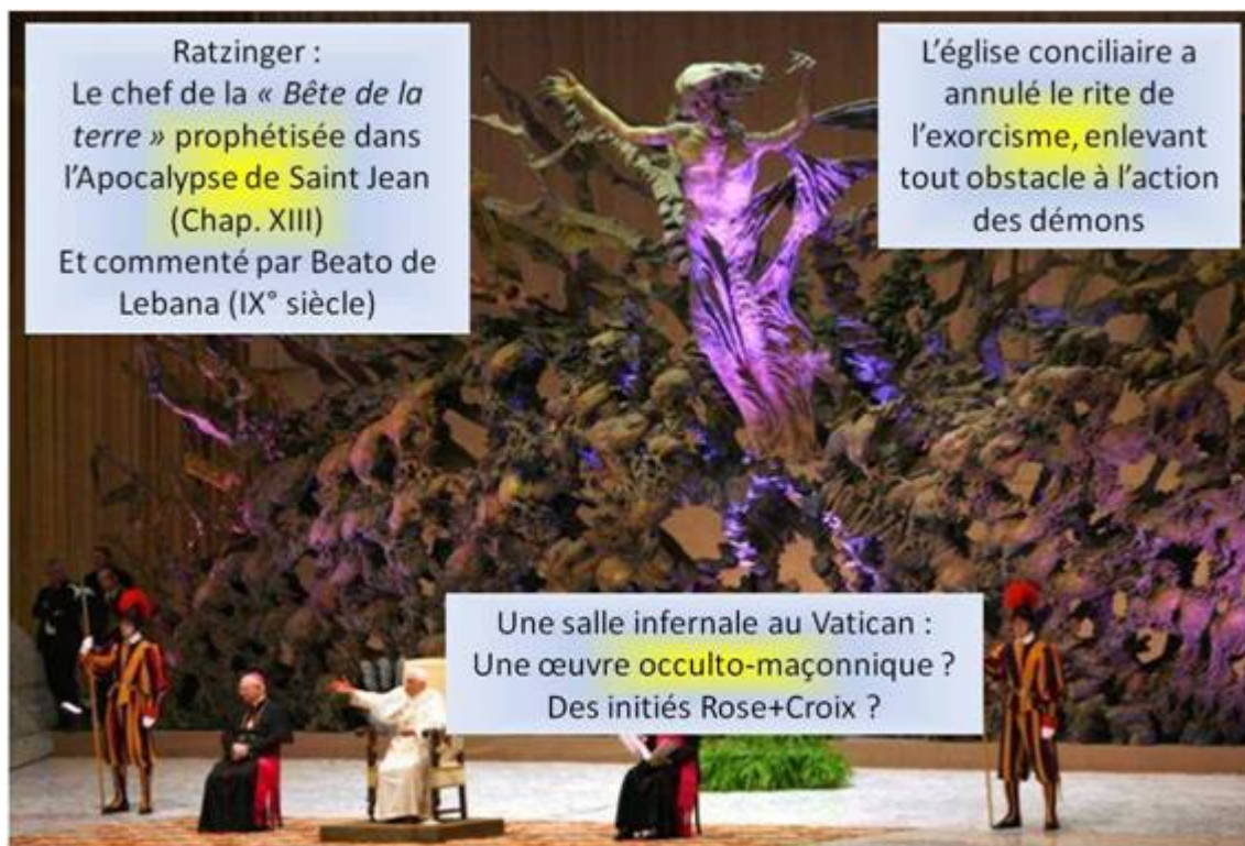
L'abbé apostat Joseph Ratzinger dans la salle Paul VI au Vatican