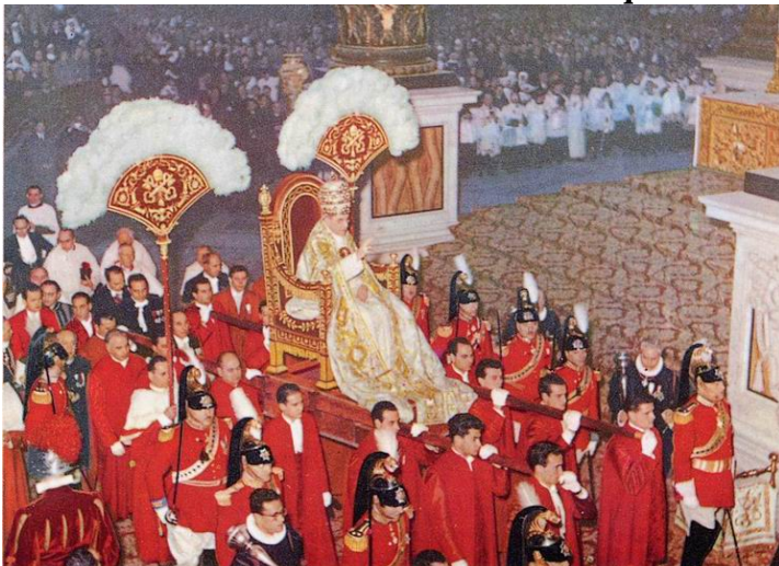
Pape Pie XII