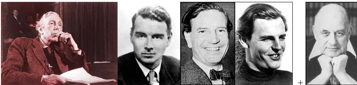
Anthony Blunt, Guy Burgess, Kim Philby, Donald Mac Lean + Victor Rothschild