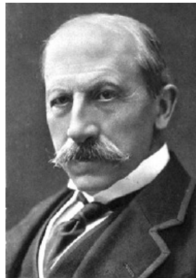
Lord Alfred Milner (1854 – 1925)

les affaires impériales et la politique étrangère de la Grande-Bretagne [...] La branche américaine de la compagnie anglaise étendait une grande partie de son influence sur cinq journaux américains (le New York Times, le New York Herald Tribune, le Christian Science Monitor, le Washington Post et le regretté Boston Evening Transcript). » 11