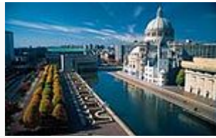
Église de Boston

« depuis son origine, la Science chrétienne publie des témoignages de guérison spirituelle. Leur nombre est impressionnant (...) [Les scientifiques chrétiens] ne préconisent pas un refus radical des soins médicaux. Simplement, ils pensent que l'approche médicale met trop l'accent sur la matérialité du corps, ce qui a pour conséquence de détourner l'homme de leur conception du monde comme idée divine. » 4