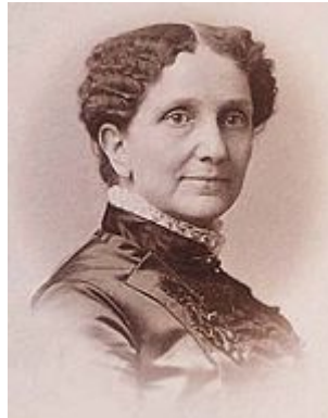
Mary Baker Eddy

Selon les propres termes de Mary Baker Eddy, extrait de son ouvrage, Manuel de l'Eglise Mère, articles de foi , la doctrine de la « Christian Science » professe le principe de la Sola scriptura typique des protestants qui écartent le Magistère de l'Église :