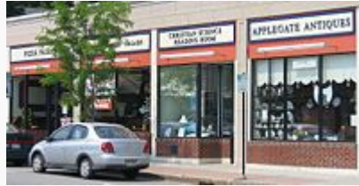
Salle de lecture, Boston, États-Unis