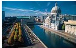
Église de Boston

« depuis son origine, la Science chrétienne publie des témoignages de guérison spirituelle. Leur nombre est impressionnant (...) [Les scientifiques chrétiens] ne préconisent pas un refus radical des soins médicaux. Simplement, ils pensent que l'approche médicale met trop l'accent sur la matérialité du corps, ce qui a pour conséquence de détourner l'homme de leur conception du monde comme idée divine. » 4