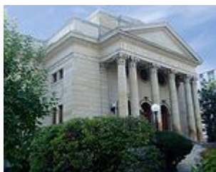
Première Église du Christ, Scientiste, Ottawa, Canada

La Science chrétienne commence sa croissance à Boston à partir de 1882 grâce au travail de « guérison » effectué par les coreligionnaires formés par Mary Baker Eddy 11 . Le mouvement est rejoint par de nombreuses personnes issues des églises protestantes traditionnelles, ce qui suscite contre lui l'opposition du clergé orthodoxe 11 .