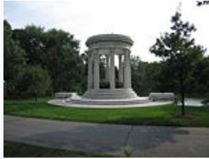
Mémorial funéraire de Mary Baker Eddy à Boston

Mary Baker Eddy meurt en 1910, âgée de 89 ans.