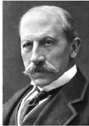
Lord Alfred Milner (1854 – 1925)

les affaires impériales et la politique étrangère de la Grande-Bretagne [...] La branche américaine de la compagnie anglaise étendait une grande partie de son influence sur cinq journaux américains (le New York Times, le New York Herald Tribune, le Christian Science Monitor, le Washington Post et le regretté Boston Evening Transcript). » 11