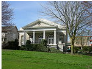
Ancienne 5 e Église du Christ, Scientiste - à présent Rainier Valley Cultural Center, Seattle, États-Unis

Selon le sociologue Rodney Stark, la Science chrétienne atteint son apogée en 1936 avec 2 048 adhérents par million d'Américains d'après ses estimations. Ensuite, le nombre d'adeptes de la Science chrétienne ne cesse de baisser aux États-Unis pour atteindre, toujours selon lui, 427 adhérents par million d'Américains en 1990 43 . Pour le sociologue, il faut y voir la conséquence