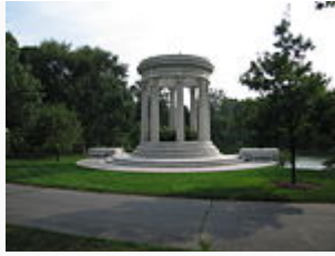
Mémorial funéraire de Mary Baker Eddy à Boston

Mary Baker Eddy meurt en 1910, âgée de 89 ans.