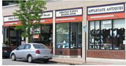
Salle de lecture, Boston, États-Unis