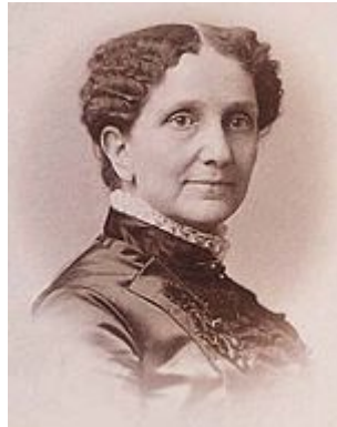
Mary Baker Eddy

Selon les propres termes de Mary Baker Eddy , extrait de son ouvrage, Manuel de l'Eglise Mère, articles de foi , la doctrine de la « Christian Science » professe le principe de la Sola scriptura typique des protestants qui écartent le Magistère de l'Église :