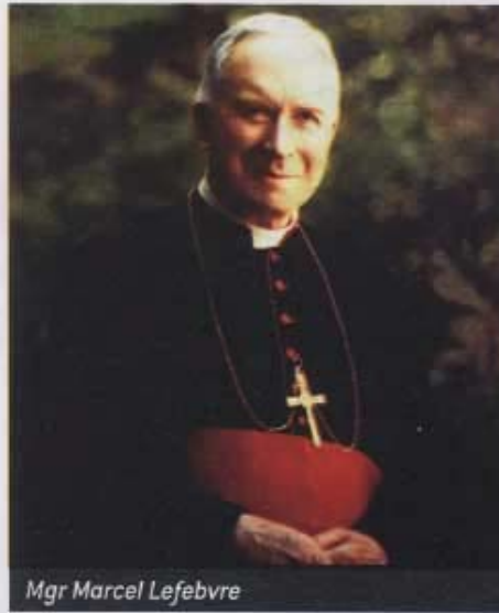
Mgr Marcel Lefebvre

« Ce n'est pas une petite chose qui nous oppose. Il ne suffit pas qu'on nous dise: vous pouvez dire la messe ancienne, mais il faut accepter cela. Non, ce n'est pas que cela qui nous oppose, c'est la doctrine. C'est clair. »